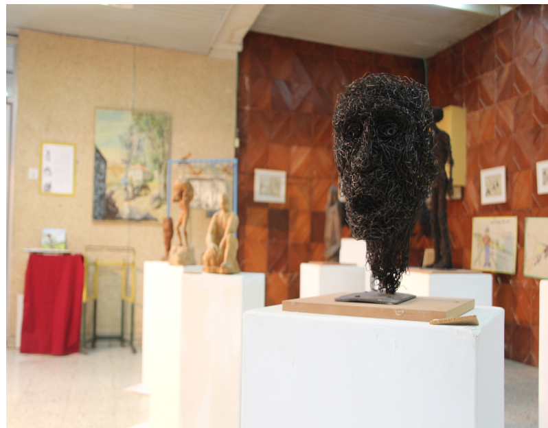
מתוך תערוכתו של אביגדור כהן הוצגה בחדר האוכל קיץ 2015